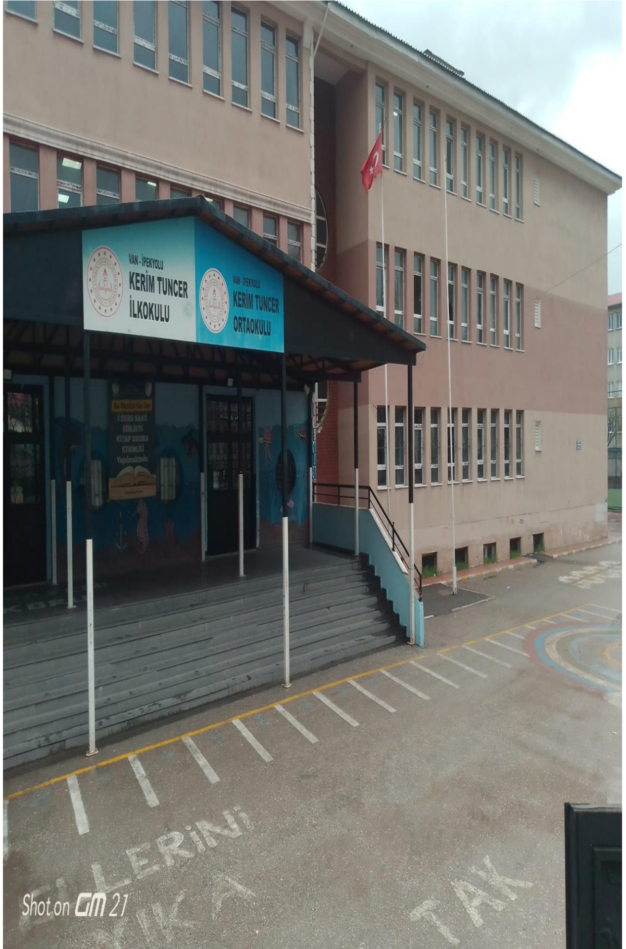
KERİM TUNCER İLKOKULU